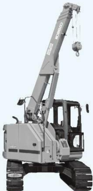
■ 定格総荷重表(単位:kg)