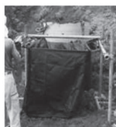
通常工法 (単管工法)